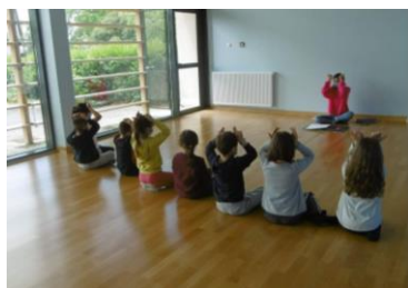
Atelier de sensibilisation à la LSF à l'accueil de loisirs d'Ayen (19)

Familles : apprendre une langue en famille, parents/enfants, frères/sœurs, etc. et favoriser les moments de complicités.