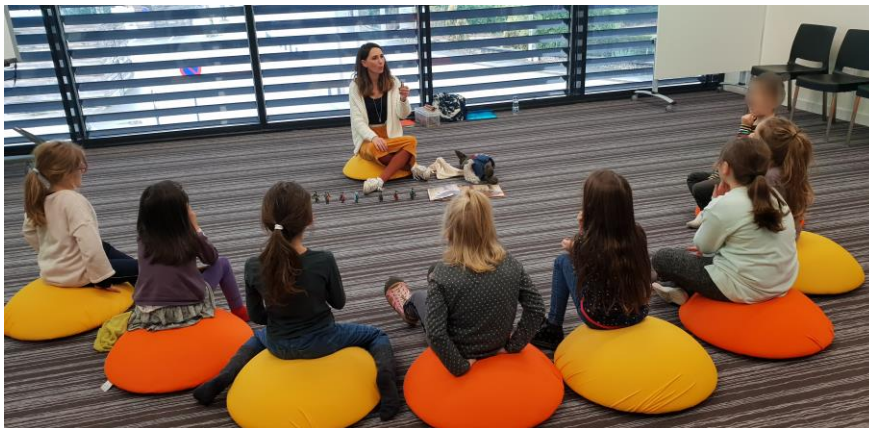
Atelier découverte de la LSF - Médiathèque d'Argentat - 2019

L'apprentissage de la langue des signes française, la LSF, se fait en silence ou presque. Par le mime, la gestuelle du corps, la description d'images pour acquérir petit à petit le vocabulaire. Le haut du corps est en mouvement, le regard est appuyé. Les chaises ou coussins sont en demi cercle afin que tous le monde se voit.