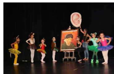
Danse et Langue des Signes : Représentation chorégraphiée et signée « Le Monsieur qui a perdu son oreille » - 2017 Projet mené avec