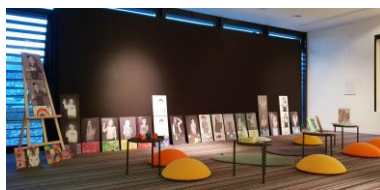
Exposition photo présentée à la Médiathèque d'Argentan (19) : « Des couleurs et des émotions »

Des photos d'enfants sourds et entendants entrain de faire des signes de la LSF sur le thème « Des couleurs et des émotions ». Chaque signe est représenté par le dessin réalisé par l'enfant.