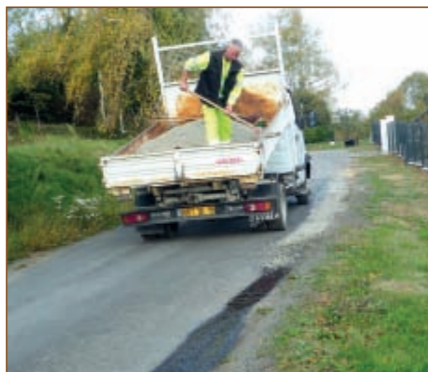
L'équipe technique sur les routes