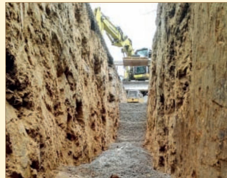
Photo prise depuis l'intérieur des blindages à 4 m de profondeur en vue d'une extension possible

La particularité géographique du chantier a nécessité la fermeture temporaire des voies communales reliant Berchat à la RD 44 et de celle reliant Le Pontal à La Grandie. ■