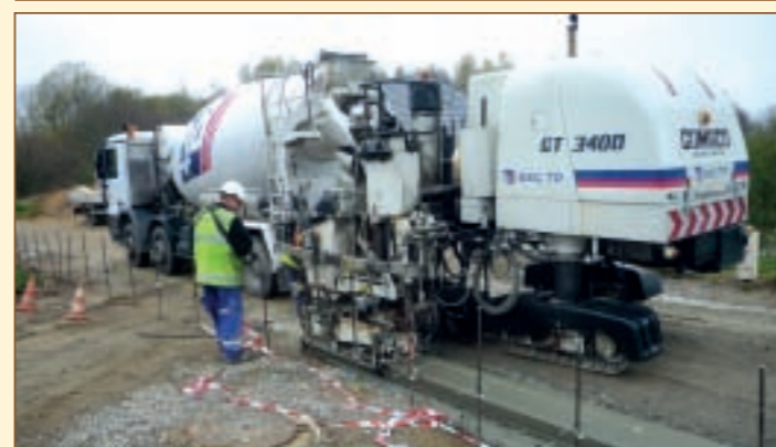
Réalisation des caniveaux en béton coulé

Les entreprises DUCHATELET et EUROVIA ont réalisé ces prestations qui ont consisté à niveler les voies pour qu'elles reçoivent les couches d'enrobés ou d'enduits selon les travaux initialement prévus.