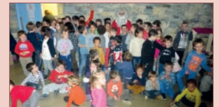
Noël à la garderie

Cette journée de Noël est appelée à être renouvelée et renforcée en 2016, en lien avec l'ensemble des acteurs de l'école, des plus petits aux plus grands.